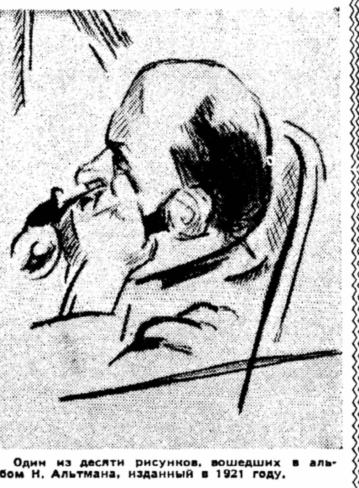
Один из десяти рисунков, вошедших в альбом Н. Алтмана, изданный в 1921 году.

ЛЕНИНГРАД — Когда я готовил и издало свой альбом, — вспоминает Натан Алтман, — у меня оставалось 12 зарисовок. К печати я отобрал десять. Мне казалось, что эти две зарисовки, которые я сделал 28 мая 1920 года, — в день приезда Ленинских делегаций английских рабочих, — черт-то напоминают те, что я уже отобрал к изданию. И я их отложил. Сейчас, много лет спустя, я различаю в них новые для меня детали, иной ракурс, другие линии. Я с большой радостью передал их для опубликования в «Литературной газете» к 90-летию со дня рождения Владимира Ильича.