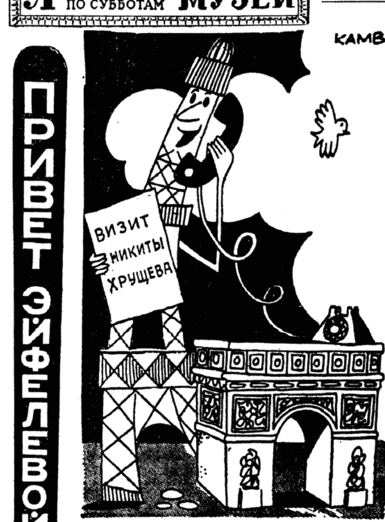
— Алло, Москва! Говорит Париж, Париж... по буквам — Привет, Аллодисменты, Радость, Исключительность, Жизнь!