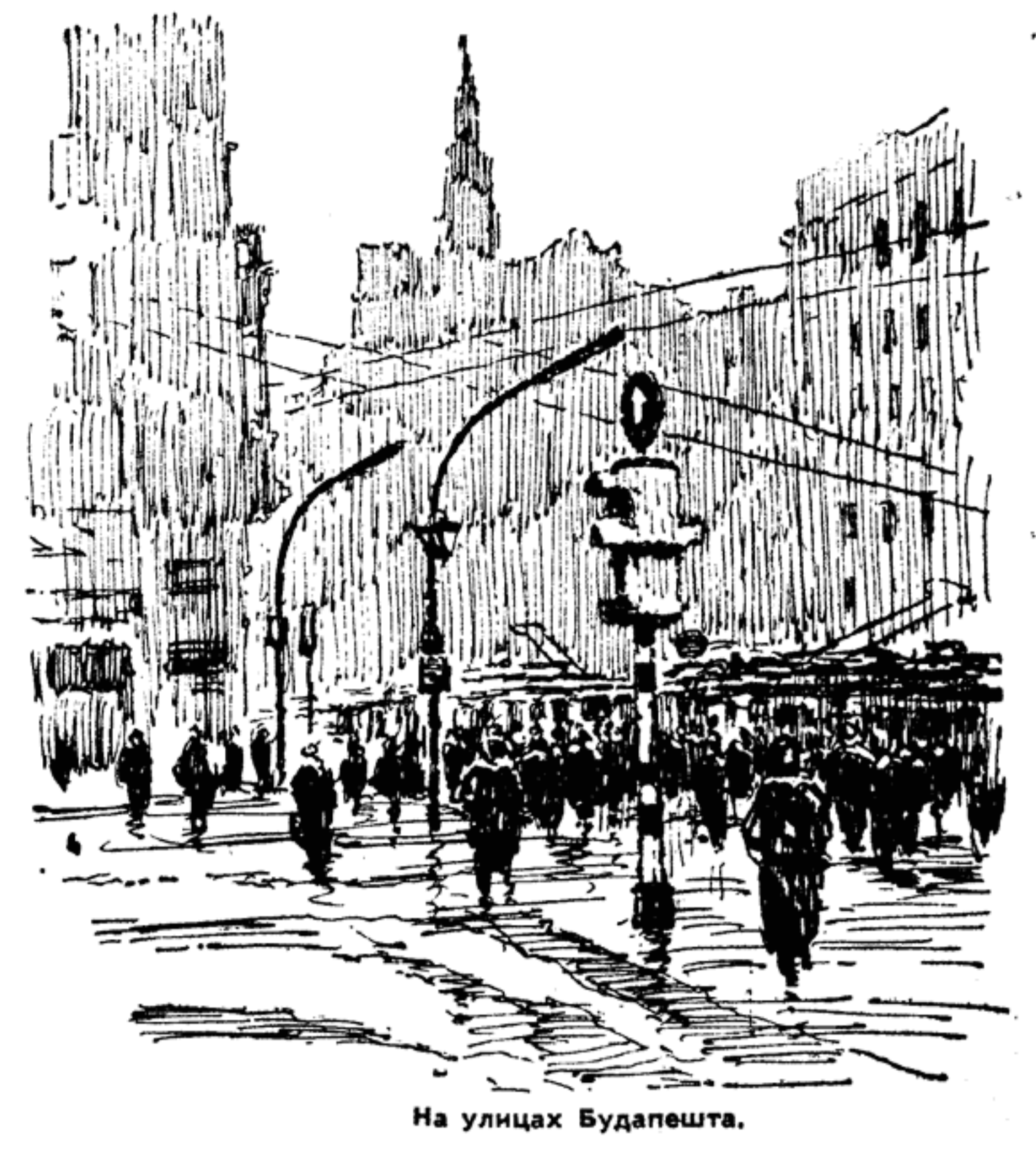
На улицах Будапешта.

В ПЕРВЫЕ я увидел Чепель с вершины горы Геллерт, откуда открывается великолепный вид на Будапешт. На острове, образованном двумя рукавами Дуная, громоздятся приземистые заводиные цеха.